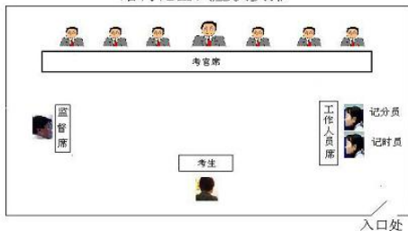
结构化面试座次安排

结构化面试对整个面试的实施、提问方式、时间、评分标准等过程因素都有严格的规定，这些因素在面试前应当经过相当完整的设计，不得随意变动。结构化面试具有内容确定、程序严格、评分统一、形式活而不乱等特点。一般情况 5-9 名考官，考生随机抽签决定面试顺序，按照固定的流程回答固定的 3-4 道题目，考官现场打分。