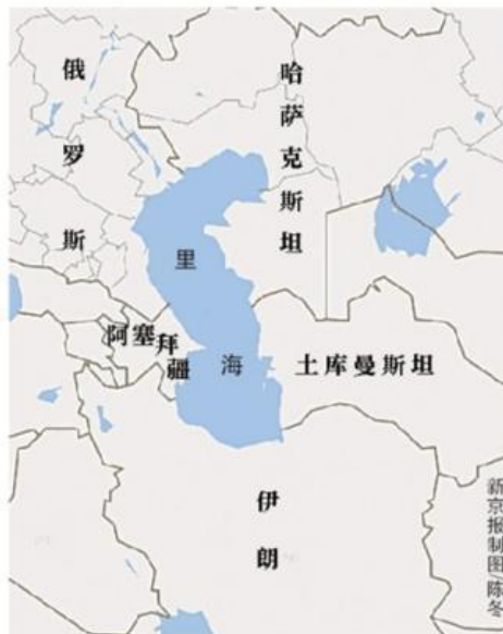
里海沿岸五国位置示意图

根据会后签署的公约，里海沿岸国家海岸线往外延伸 15海里 的水域为该 国领海 ，领海往外再延伸 10海里 的水域为该 国专属捕鱼区 ，其它水体以及这些水体的渔业资源将由里海沿岸5国共同拥有。